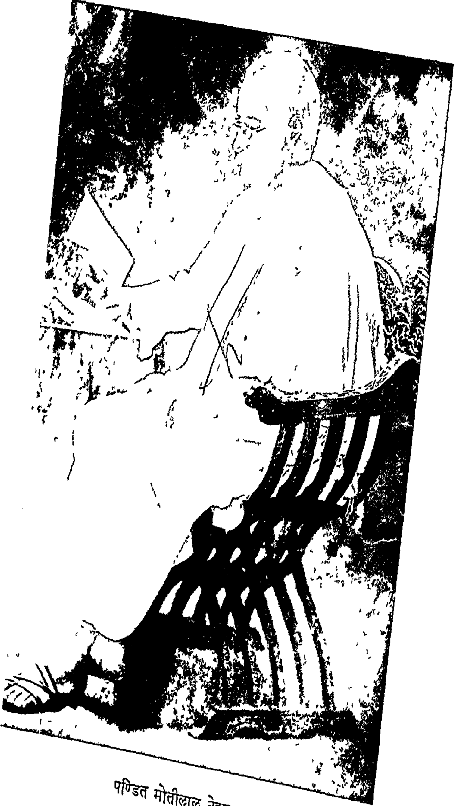
पण्डित मोतीलाल नेहरू